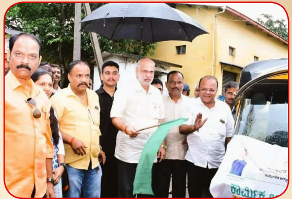
ಕಾರ್ಮಿಕ ಅದಾಲತ್ 2.0 ಅಭಿಯಾನದ ಜನಜಾಗೃತಿ ಪ್ರಚಾರ ವಾಹನಕ್ಕೆ ಚಾಲನೆ ನೀಡಿದರು.