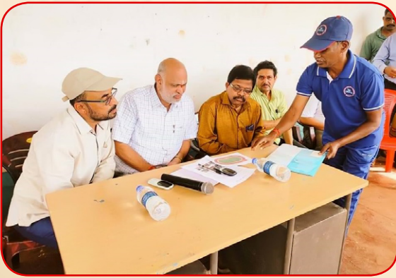
ಯಲ್ಲಾಪುರ ಪಟ್ಟಣದ ತಾಲೂಕಾ ಕ್ರೀಡಾಂಗಣದ ಅಭಿವೃದ್ಧಿಯ ಕುರಿತಂತೆ ಮೈದಾನದಲ್ಲಿ ಹಿರಿಯ ಕ್ರೀಡಾಪಟುಗಳ ಜೊತೆಯಲ್ಲಿ ಸಭೆ ನಡೆಸಿದರು.