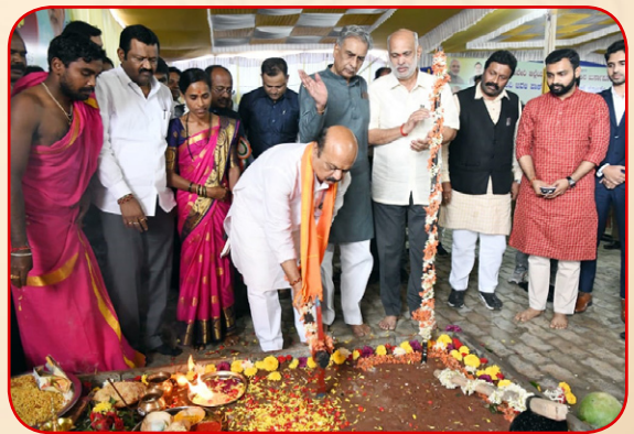
ಮುಖ್ಯಮಂತ್ರಿಗಳಾದ ಶ್ರೀ ಬಸವರಾಜ ಬೊಮ್ಮಾಯಿ ಅವರೊಂದಿಗೆ ಸಿದ್ದ ಉಡುಪು ತಯಾರಿಕಾ ಘಟಕಕ್ಕೆ ಭೂಮಿ ಪೂಜೆಯನ್ನು ನೆರವೇರಿಸಿದರು.