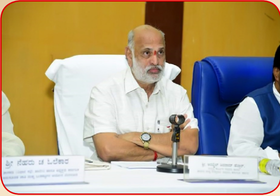
ಮಳೆ ಹಾನಿಗೆ ಸಂಬಂಧಿಸಿದಂತೆ ಹಾವೇರಿ ಜಿಲ್ಲಾಧಿಕಾರಿ ಕಾರ್ಯಾಲಯದಲ್ಲಿ ಜಿಲ್ಲಾ ಮಟ್ಟದ ಅಧಿಕಾರಿಗಳ ಸಭೆ ನಡೆಸಿದರು.