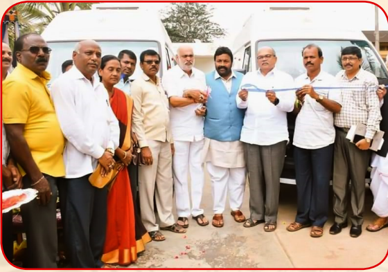
ಹಾವೇರಿ ಜಿಲ್ಲೆಯ ಹಿರೇಕೆರೂರ ತಾಲೂಕಿನಲ್ಲಿ ವಿವಿಧ ಅಭಿವೃದ್ಧಿ ಕಾಮಗಾರಿಗಳಿಗೆ ಚಾಲನೆ ನೀಡಿದರು.