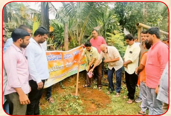
ತಾಲೂಕಾ ಯುವ ಮೋರ್ಚಾ ಘಟಕದ ವತಿಯಿಂದ ಆಯೋಜಿಸಿದ್ದ ವನ ಮಹೋತ್ಸವ ಕಾರ್ಯಕ್ರಮಕ್ಕೆ ಚಾಲನೆ ನೀಡಿದರು.