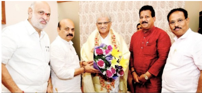
ರಾಜ್ಯ ಸರ್ಕಾರದ ಕಾರ್ಮಿಕರ ಸೇವೆಗಳನ್ನು ಉತ್ತರಿಸಿ ನೀಡುವ ಬಗ್ಗೆ ಸರ್ಕಾರದ ಅಧಿಕಾರಿಗಳು. ಕಾರ್ಮಿಕ ಸಚಿವರಿಂದ ಸನ್ಮಾನಿಸಲ್ಪಟ್ಟು, ವಿವಿಧ ಅಧಿಕಾರಿಗಳಿಗೆ, ವಿಶ್ವವಿದ್ಯಾಲಯದ ಅಧಿಕಾರಿಗಳಿಗೆ ನೀಡಲಾಯಿತು.