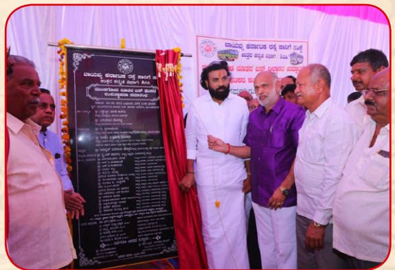
ಮುಂಡಗೋಡ ತಾಲೂಕಿನ ಬಹುಕಾಲದ ಬೇಡಿಕೆಯಾದ ಸುಸಜ್ಜಿತ ಬಸ್ ನಿಲ್ದಾಣವನ್ನು ಸಾರಿಗೆ ಸಚಿವರಾದ ಶ್ರೀ ಬಿ.ಶ್ರೀರಾಮುಲು ಅವರೊಂದಿಗೆ ಉದ್ಘಾಟಿಸಿದರು.