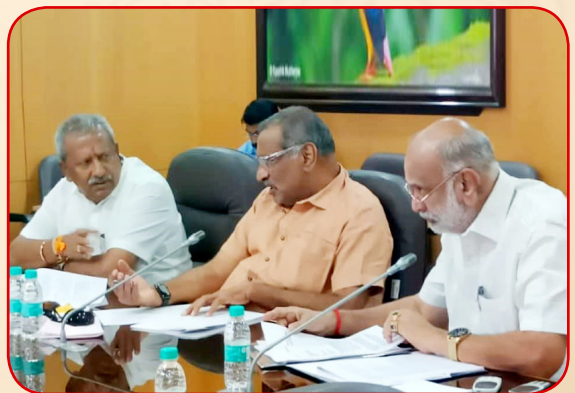
ಇ - ಸ್ವತ್ತು ಸಮಸ್ಯೆ ಬಗೆಹರಿಸುವ ಕುರಿತು ನಡೆದ ಸಚಿವ ಸಂಪುಟದ ಉಪಸಮಿತಿಯ ಸಭೆಯಲ್ಲಿ ಪಾಲ್ಗೊಂಡರು.