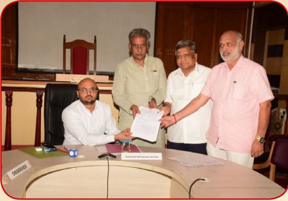
ಪಶ್ಚಿಮ ಶಿಕ್ಷಕರ ಕ್ಷೇತ್ರದ ವಿಧಾನಪರಿಷತ ಚುನಾವಣೆಯಲ್ಲಿ ಭಾರತೀಯ ಜನತಾ ಪಕ್ಷದ ಅಭ್ಯರ್ಥಿ ಶ್ರೀ ಬಸವರಾಜ ಹೊರಟ್ಟಿ ಅವರ ನಾಮಪತ್ರ ಸಲ್ಲಿಕೆ ಪ್ರಕ್ರಿಯೆಯಲ್ಲಿ ಪಾಲ್ಗೊಂಡರು.