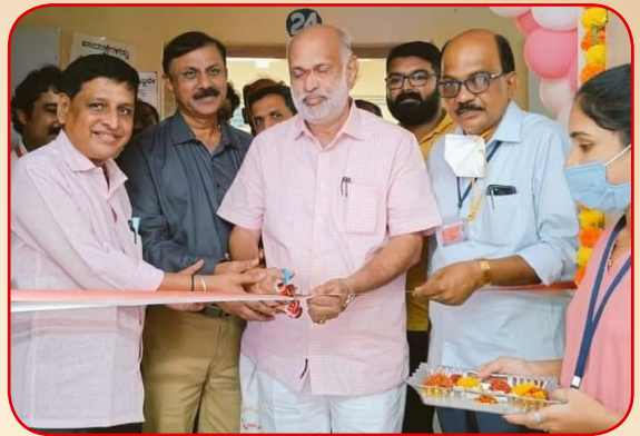
ಮುಂಡಗೋಡ ಪಟ್ಟಣದ ಸರಕಾರಿ ಸಾರ್ವಜನಿಕ ಆಸ್ಪತ್ರೆಯಲ್ಲಿ ತಮ್ಮ ಸಮೂಹ ಸಂಸ್ಥೆ ಹಾಗೂ ಸೆಲ್ಯೋ ಫೌಂಡೇಶನ್ ಅಡಿಯಲ್ಲಿ ನಿರ್ಮಾಣ ಸೌರಶಕ್ತಿ ಆಧಾರಿತ ಪ್ರಸೂತಿ ಗೃಹವನ್ನು ಉದ್ಘಾಟಿಸಿದರು.