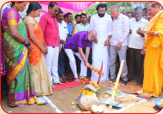
ಮುಂಡಗೋಡ ತಾಲೂಕಿನ ಬಹುಕಾಲದ ಬೇಡಿಕೆಯಾದ ಬಸ್ ಘಟಕ ನಿರ್ಮಾಣ ಕಾಮಗಾರಿಗೆ ಸಾರಿಗೆ ಸಚಿವರಾದ ಶ್ರೀ ಬಿ.ಶ್ರೀರಾಮುಲು ಅವರೊಂದಿಗೆ ಚಾಲನೆ ನೀಡಿದರು.