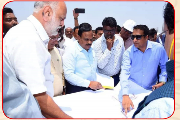
ಹಾವೇರಿಯ ವೈದ್ಯಕೀಯ ಮಹಾವಿದ್ಯಾಲಯದ ನಿರ್ಮಾಣ ಕಾಮಗಾರಿ ಪ್ರಗತಿ ಪರಿಶೀಲನೆಯನ್ನು ನಡೆಸಿದರು.