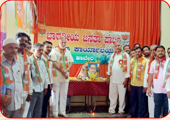
ಹಾವೇರಿ ಜಿಲ್ಲಾ ಭಾರತೀಯ ಜನತಾ ಪಕ್ಷದ ಕಾರ್ಯಾಲಯದಲ್ಲಿ ಡಾ.ಬಿ.ಆರ್.ಅಂಬೇಡ್ಕರ್ ಜಯಂತಿ ಅಂಗವಾಗಿ ಆಯೋಜಿಸಿದ್ದ ಕಾರ್ಯಕ್ರಮದಲ್ಲಿ ಪಾಲ್ಗೊಂಡರು.