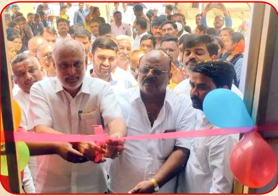
ಮುಂಡಗೋಡ ಪಟ್ಟಣದ ಸರಕಾರಿ ಪದವಿ ಪೂರ್ವ ಕಾಲೇಜಿಗೆ ವಿ.ಆರ್.ಎಮ್.ಪಿ ಡಿಸ್ಟಿಲರಿಸ್ ಆಂಡ್ ಶುಗರ್ಸ್ ಪ್ರೈವೇಟ್ ಲಿಮಿಟೆಡ್ ನ ಸಿ.ಎಸ್.ಆರ್. ಅನುದಾನದ ಅಡಿಯಲ್ಲಿ ನಿರ್ಮಾಣ ಮಾಡಿರುವ ಶುದ್ಧ ಕುಡಿಯುವ ನೀರಿನ ಘಟಕವನ್ನು ಉದ್ಘಾಟಿಸಿದರು.