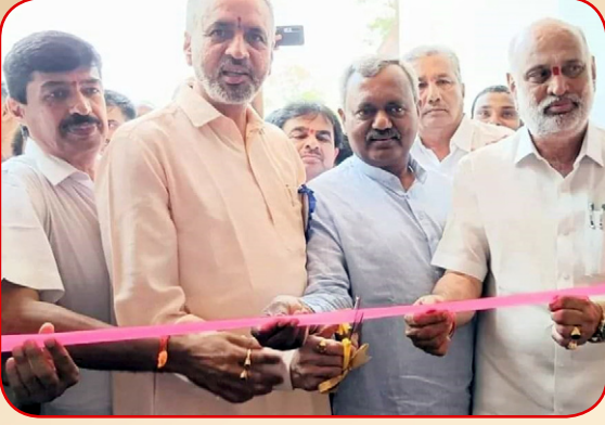
ಸಹಕಾರಿ ಸಚಿವರಾದ ಎಸ್.ಟಿ.ಸೋಮಶೇಖರ್ ಹಾಗೂ ಸಭಾಧ್ಯಕ್ಷರಾದ ವಿಶ್ವೇಶ್ವರ ಹೆಗಡೆ ಕಾಗೇರಿ ಅವರೊಂದಿಗೆ ಶಿರಸಿಯ ಹನುಮಂತಿಯಲ್ಲಿ ಶಿರಸಿ ಡೈರಿಯನ್ನು ಉದ್ಘಾಟಿಸಿದರು.