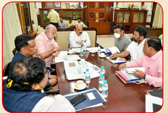
ಮಾನ್ಯ ಮುಖ್ಯಮಂತ್ರಿಗಳಾದ ಶ್ರೀ ಬಸವರಾಜ ಬೊಮ್ಮಾಯಿ ಅವರ ಅಧ್ಯಕ್ಷತೆಯಲ್ಲಿ ಹಾವೇರಿ ಜಿಲ್ಲಾ ವೈದ್ಯಕೀಯ ಮಹಾವಿದ್ಯಾಲಯ ಪ್ರಗತಿ ಪರಿಶೀಲನಾ ಸಭೆ ನಡೆಸಿದರು.