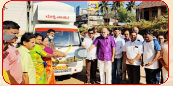
ಹೆಬ್ಬಾರ್ ಡ್ರೀಮ್ ಫೌಂಡೇಶನ್ ಟ್ರಸ್ಟ್ ವತಿಯಿಂದ ಯಲ್ಲಾಪುರ ಪಟ್ಟಣ ಪಂಚಾಯತಕ್ಕೆ ಮುಕ್ತಿ ವಾಹನವನ್ನು ಹಸ್ತಾಂತರಿಸಿದರು.