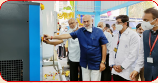
ಬೆಂಗಳೂರಿನ ರಾಜಾಜಿನಗರದ ರಾಜ್ಯ ಕಾರ್ಮಿಕ ವಿಮಾ ಆಸ್ಪತ್ರೆಯಲ್ಲಿ ನೂತನ ಆಕ್ಸಿಜನ್ ಉತ್ಪಾದನಾ ಘಟಕವನ್ನು ಉದ್ಘಾಟಿಸಿದರು.