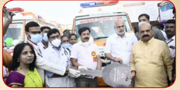
ಶ್ರಮಿಕ ಸಂಜೀವಿನಿ ಸಂಚಾರಿ ಚಿಕಿತ್ಸಾ ಘಟಕಕ್ಕೆ ಹುಬ್ಬಳ್ಳಿಯಲ್ಲಿ ಚಾಲನೆ ನೀಡಿದರು.