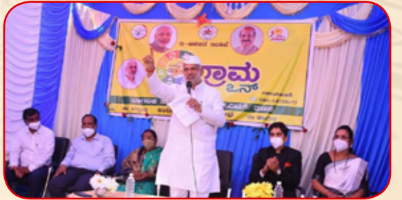
ಗ್ರಾಮ ಒನ್ ವಿನೂತನ ಯೋಜನೆಗೆ ಹಾವೇರಿ ಜಿಲ್ಲೆ ಎನ್.ಎಮ್.ತಡಸ ಗ್ರಾಮದಲ್ಲಿ ಚಾಲನೆ ನೀಡಿದರು