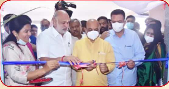
ಮುಖ್ಯಮಂತ್ರಿಗಳಾದ ಸನ್ಮಾನ್ಯ ಶ್ರೀ ಬಸವರಾಜ ಬೊಮ್ಮಾಯಿ ಅವರೊಂದಿಗೆ ಹುಬ್ಬಳ್ಳಿಯಲ್ಲಿ ಕಾರ್ಮಿಕ ಭವನವನ್ನು ಉದ್ಘಾಟಿಸಿದರು.