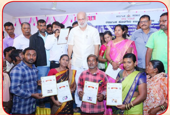
30 ವರ್ಷಗಳ ನಂತರ ಮೊಟ್ಟಮೊದಲ ಬಾರಿಗೆ ಮುಂಡಗೋಡ ಪಟ್ಟಣದ ಕೊಳಗೇರಿ ನಿವಾಸಿಗಳಿಗೆ ಅಧಿಕೃತ ಹಕ್ಕು ಪತ್ರವನ್ನು ವಿತರಿಸಿದರು.