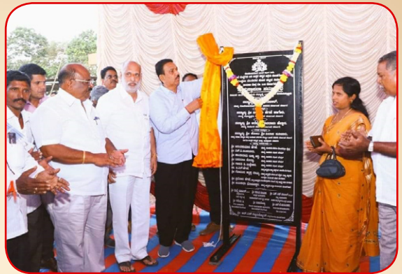
ಮುಂಡಗೋಡ ತಾಲೂಕಿನಾದ್ಯಂತ 34 ಕೋಟಿ ರೂಪಾಯಿ ವೆಚ್ಚದಲ್ಲಿ ಲೋಕೋಪಯೋಗಿ ಇಲಾಖೆಯ ಸಚಿವರಾದ ಸಿ.ಸಿ.ಪಾಟೀಲ್ ಅವರೊಂದಿಗೆ ವಿವಿಧ ಅಭಿವೃದ್ಧಿ ಕಾಮಗಾರಿಗೆ ಚಾಲನೆ ನೀಡಿದರು.