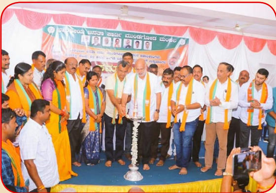
ಮುಂಡಗೋಡ ಪಟ್ಟಣದ ಟೌನ್ ಹಾಲ್ ನಲ್ಲಿ ಕಾರ್ಯಕರ್ತರ ಸಭೆಯನ್ನು ಉದ್ಘಾಟಿಸಿದರು.