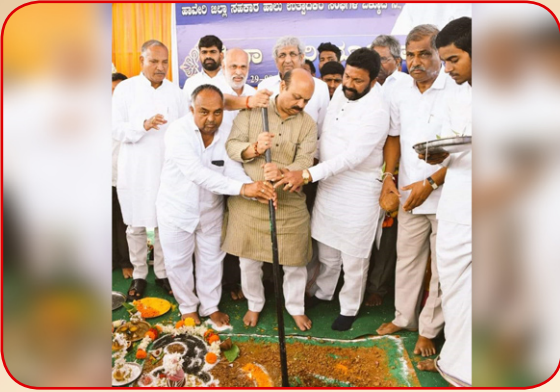
ಮುಖ್ಯಮಂತ್ರಿಗಳಾದ ಬಸವರಾಜ ಬೊಮ್ಮಾಯಿ ಅವರೊಂದಿಗೆ ಹಾವೇರಿಯಲ್ಲಿ ವಿವಿಧ ಅಭಿವೃದ್ಧಿ ಕಾಮಗಾರಿಗಳಿಗೆ ಚಾಲನೆ ನೀಡಿದರು.