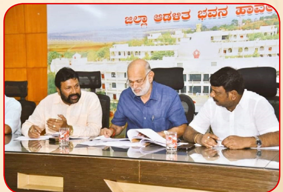
ಹಾವೇರಿ ಜಿಲ್ಲಾಧಿಕಾರಿ ಕಚೇರಿಯ ಸಭಾಂಗಣದಲ್ಲಿ ಪ್ರಗತಿ ಪರಿಶೀಲನಾ ಸಭೆ ನಡೆಸಿದರು.